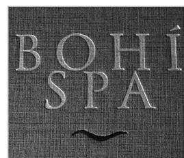
Termograbado + Bajorelieve