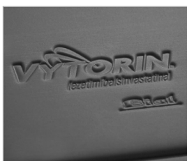
Bajorelieve sobre vinilo expandido