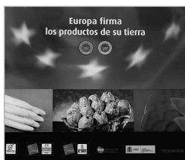
CMYK sobre Polipropileno