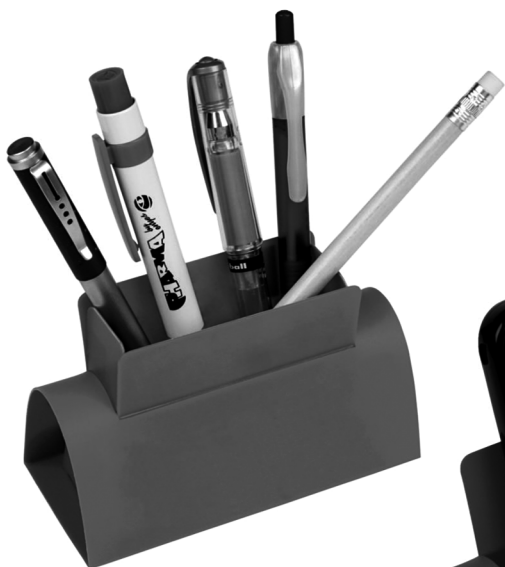
3200.1 SOPORTE-CUBILETE Tamaño cuerpo 11'7 x 5'5 x 5 cm. Tamaño hueco cubilete 8 x 2'5 x 8 cm.