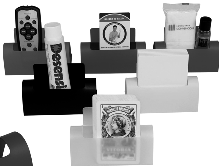
3200 SOPORTE-EXPOSITOR EN POLIPROPILENO Personalizable en todo su exterior. Tamaño cuerpo 11'7 x 5'5 x 5 cm. (solapa aparte)

Como cada año seguimos innovando en nuestros productos. En este 2014 les ofrecemos un nuevo soporte para cualquier tipo de objeto con una gran variedad de colores en polipropileno para elegir.