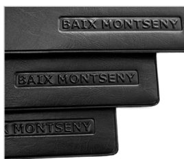
Bajorelieve sobre zieger