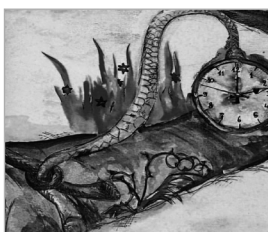
CMYK sobre vinilo