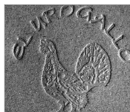
Bajorelieve sobre cartón