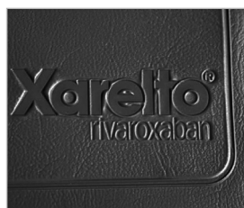
Bajorelieve sobre vinilo